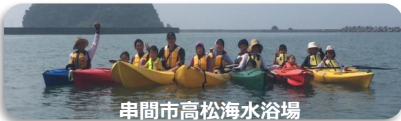
串間市高松海水浴場

宮崎県SC交流会キャンプに参加してきました。安全教育等の講習を受け、シーカヤックやSUP・海水浴・BBQを楽しみました♪